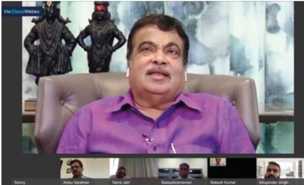
Chief Guest : Shri Nitin Jaam Gadkari Hon'ble Minister of MSME and Road Transport & Highways, Govt. of India